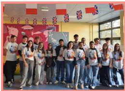
Los equipos de 1COM del instituto