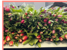
Los tulipanes listos para ser repartidos