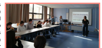
La intervención, después, de los alumnos de 2nde13

esto era "interesante y cautivador". Añade que incluso si este sector no le atrae particularmente, esta intervención les permitió descubrir y aclarar sus deseos de orientación. Fue una intervención excepcional que merece ser renovada para ayudar a los alumnos de 2nde13 a clarificar sus deseos de orientación.