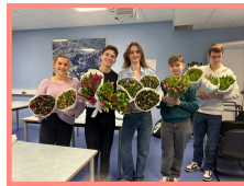
Algunos alumnos se encargan de repartir los tulipanes.

«Teníamos muchas ganas de elegir esta asociación para hacer un bonito gesto para los niños enfermos, y ver que hemos recaudado tanto dinero nos hace muy felices».