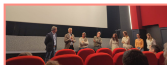
Le ciné-débat du 3 mars

Finally, the Ding'fringes group organized its second clothes barter on March 19. The event allows people to recycle their clothes and give them a second life.