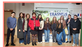
Les élèves en mobilité à Albacete avec leurs enseignantes