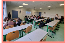
Dictée polyglotte