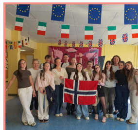
Nowegians before their departure

We have learned that school days are longer, and that the rules are stricter here than in Norway. After school we have learned a lot about French culture, such as swear words. We have also learned that the French have dessert every day, and that dinner is much later than in Norway. One difference we have noticed is that more people smoke here, even right outside the school yard.