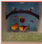
El escaparate ganador del voto del instituto