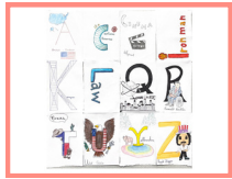
Abécédaire des langues